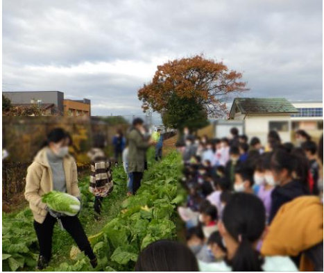
大きく育った白菜（写真左）。白菜の選び方を教えながら、児童への接し方などを体験（写真中央、学生は左の女性）。白菜の選び方や収穫の方法を説明しているところ（写真右）。