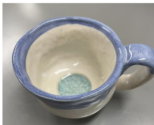
↑昨年度作成したマグカップ