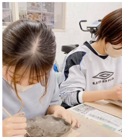
↑お皿に模様を描いている様子