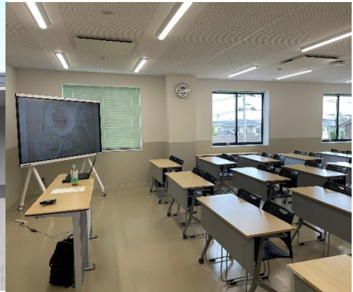
新しく完成した仙台大学川平キャンパス（仙台市）